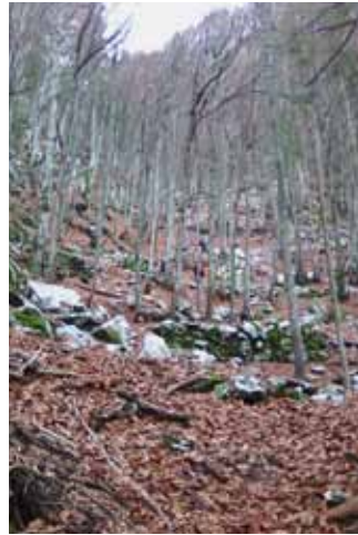
Az „öszvér út”