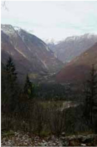
A Lepena völgy, ahonnan a túra indult