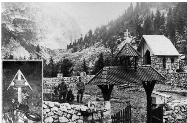
Az egykori osztrák-magyar temető, ahol ma a „magyar kereszt” áll

Amit ehhez a hadtörténész még hozzátehet: 1915. június 23. és július 7. között az első Isonzó csatában az olasz alpinik (hegyivadászok) elfoglalták a Krn hegyet is. A térségben állomásozó monarchiabeli hadosztályok kb. fele magyar katonából állt. A magashegységet sosem látott, alföldi parasztleányekből álló seregnek, használhatatlan felszereléssel esélye sem volt a magashegyi harcokra kiképzett olaszokkal szemben, akik a hegy csúcsán építették ki jól védhető állásaikat. Akkoriban, ha az egyik harcoló fél beásta magát valamelyik hegy tetején, akkor az alul maradt fél számára az bevehetetlen maradt. A Krn akkor került mégis a miénk kezére, amikor a caporettói áttörés alkalmával (1917. október 24.) az olasz front összeomlott. Egyébként pont a Krn „árnyékában” gyülekeztették azokat az osztrák-magyar csapatokat, amelyek a tolmeini-hídfő irányából észrevétlen kerülhették meg a Krn hegyet, fogságba ejtve az ott védekező olaszokat.