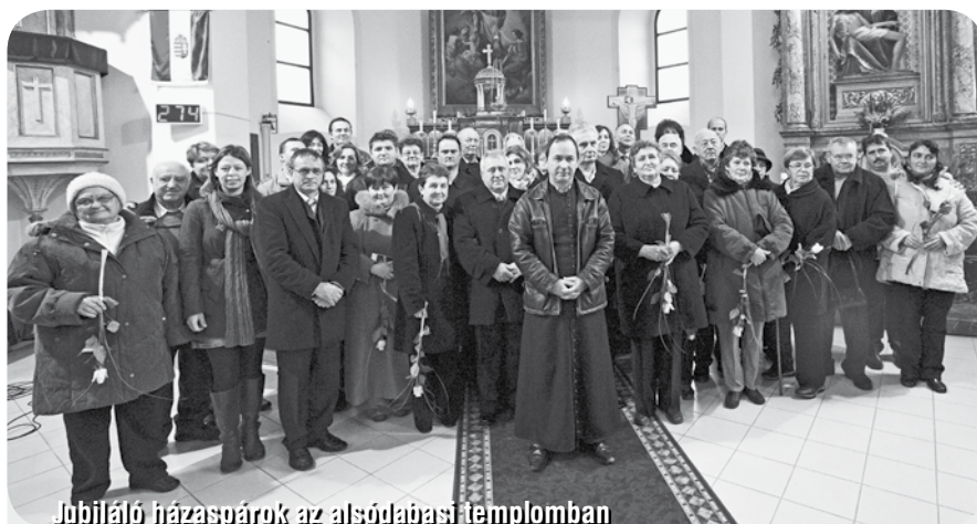
Jubiláló házaspárok az alsódabasi templomban